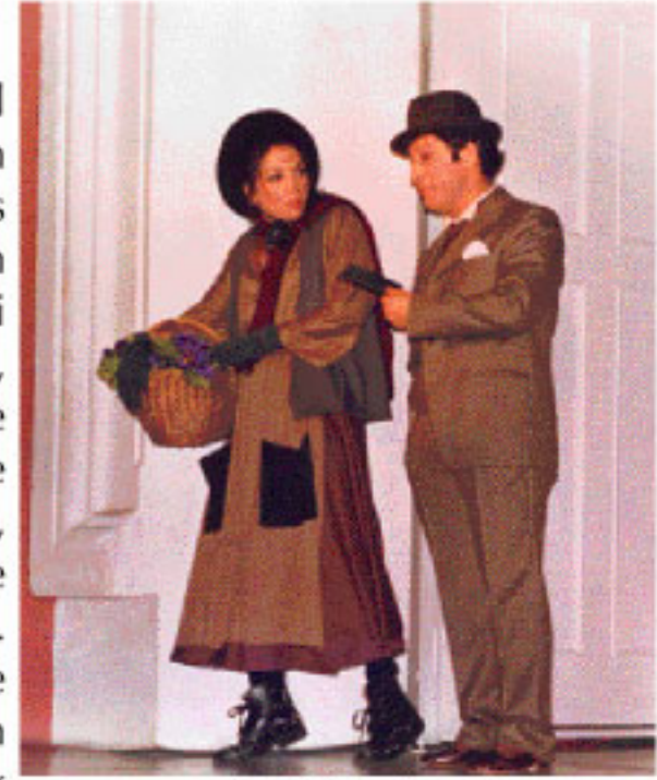
My Fair Lady