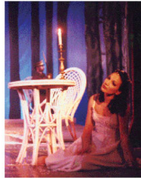
Çaykovski, Yevgeni Onegin Operası

gerektiğine inanıyorum. Bizim okulumuzda ders veren öğretmenlerimizin tümü konservatuvarlı.